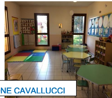
AULA SEZIONE CAVALLUCCI